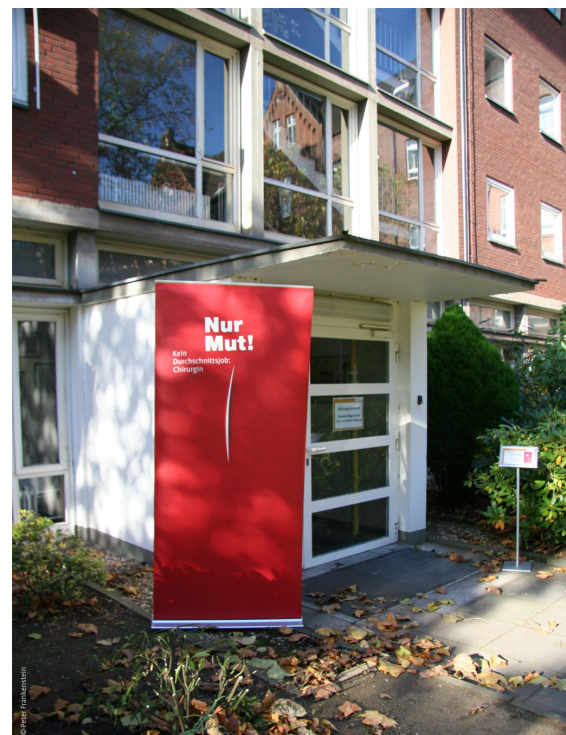
Abb. 1: Eingangsbereich

Der Workshop startete pünktlich um 10:00 Uhr in den Räumlichkeiten der Krankenpflegeschule der St. Johannes Klinik mit diversen Vorträgen aus dem