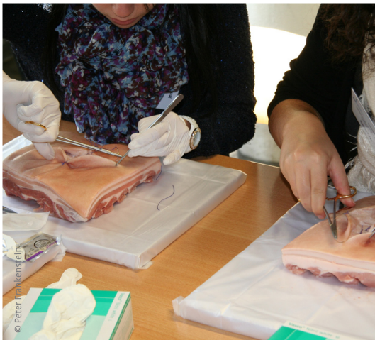
Abb. 4: Wunden nähen am Schweinepräparat