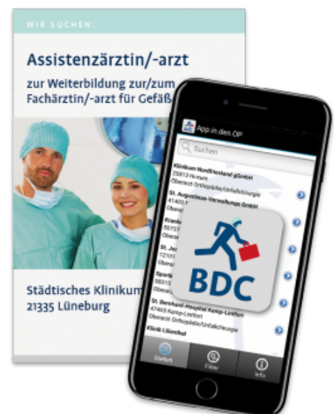
Abb. 1: Exemplarische Liste von Anzeigen auf App.in.den.OP®

Preiswert! Effizienter können Sie Stellensuchende aus dem chirurgischen Umfeld nicht erreichen! (30 Tage 300,00* €, 60 Tage 540,00* €, 90 Tage 720,00* €; *zzgl. Mwst.)