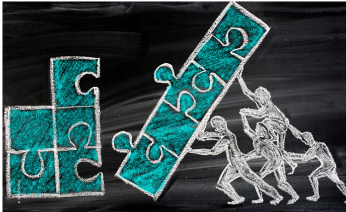
Dach Puzzleteile Kraft Halt