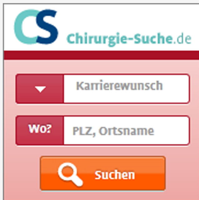
Abb. 4: Such-App „Karrieresuche“ für Partnerwebseiten

http://www.chirurg-werden.de/search/js/karriere-170x170.js