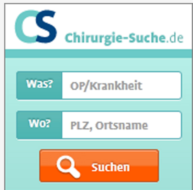
Abb. 5: Such-App „Spezialistensuche“ für Partnerwebseiten

http://www.chirurg-werden.de/search/js/schnellsuche-170x170.js